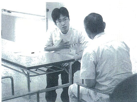
模擬患者が医学生に相談

は劇団に10年間所属した後、医師となって現在はホスピス医をつとめる女性もいる。プロの演技者としても頼もしい彼女は、医師役・患者役それぞれ大奮闘しながら、双方に通じたアドバイスも与えてくれる貴重な存在だという。そうした優れた模擬患者たちを、薫陶塾の独自ブランド商品として医療現場に提供する